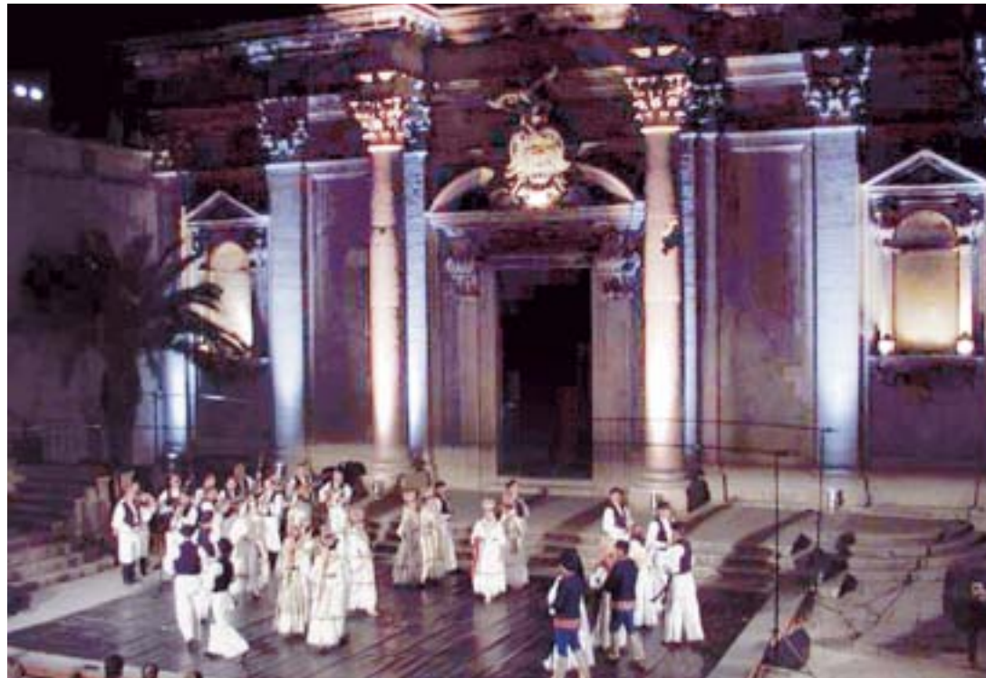
Barokna arhitektura europskoga značenja: Crkva sv. Ignacija u Dubrovniku